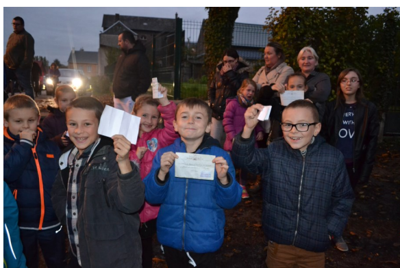
Souvenirs de la veillée 2015...

Le projet pédagogique 2016/2017 sera « Bien vivre en société », tout un programme.